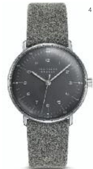
1, 2 + 3 | max bill Damen Quarz; Edelstahl; Ø 32,7 mm; Plexi-Hartglas; wasserdicht bis 3 bar; Kalbslederband mit Domschließe | Preis 495,- Euro 4 | max bill Handaufzug Edelstahl; Ø 34 mm; Plexi-Hartglas; wasserdicht bis 3 bar; Lederband mit Filzstruktur und Domschließe | Preis 625,- Euro