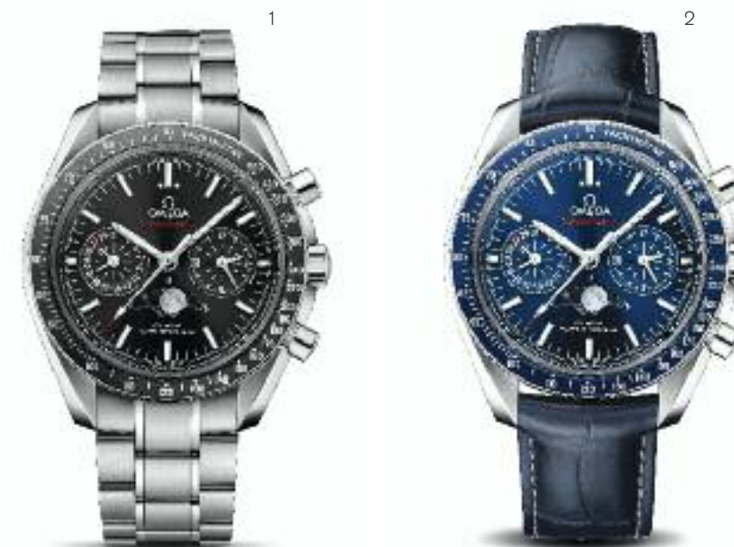
1 | Speedmaster Moonphase Chronograph Automatik; Co-Axial Master Chronometer; antimagnetisch bis 15.000 Gauß; Edelstahl Ø 44,25 mm; wasserdicht bis 10 bar; Edelstahlband | Preis 9.400,- Euro 2 | Speedmaster Moonphase Chronograph Automatik; Co-Axial Master Chronometer; antimagnetisch bis 15.000 Gauß; Edelstahl Ø 44,25 mm; wasserdicht bis 10 bar; Alligatorlederband | Preis 9.300,- Euro

Das Erbe von OMEGA basiert insbesondere auf innovativer Uhrmacherkunst. Daher halten OMEGA-Zeitmesser seit mehr als 160 Jahren die Geschichte der Erde fest – im All, in den Tiefen der Meere, bei großen Sportereignissen, an den Handgelenken von Forschern und Leinwandlegenden sowie von Frauen und Männern, die die Mischung von Leistungsstärke und Design der OMEGA-Uhren schätzen.