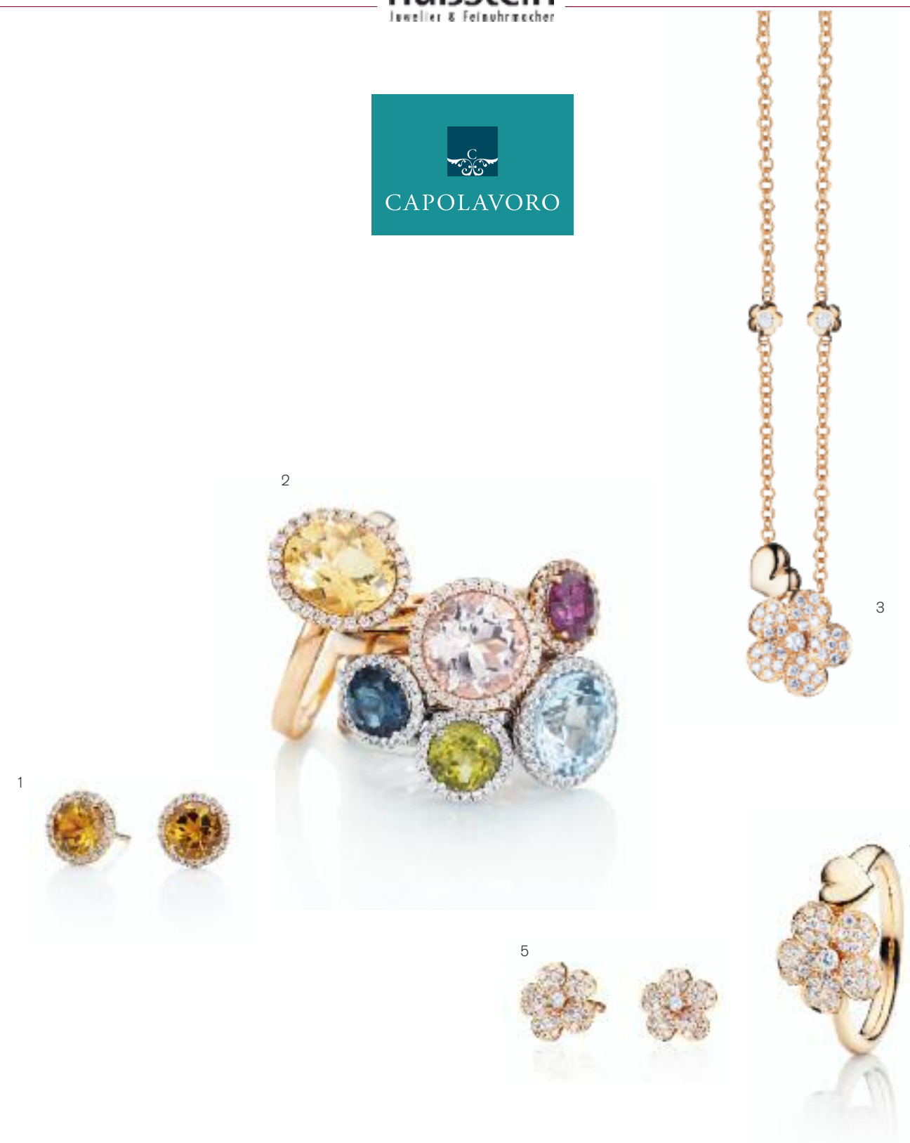
1 | Ohrstecker „Espressivo“ 750 RG; Citrin facettiert, Ø 6 mm, 44 Brillanten (ca. 0,16 ct) | Preis 1.095,- Euro 2 | Ringe „Espressivo“ 750 WG; Topas; Peridot; 750 RG; Rubelit; Morganit; London Blue Topas; Citrin; Diamanten | Preis Ø 6 mm ab 1.095,- Euro | Ø 9 mm ab 1.650,- Euro | 9x7 mm 1.750,- Euro 3 | Collier „Fiori e Cuori“ Blume/Herz 750 RG; 38 Brillanten (0,40 ct) | Preis 2.300,- Euro 4 | Ring „Fiori e Cuori“ Blume/Herz 750 RG; 36 Brillanten (0,36 ct) | Preis 2.400,- Euro 5 | Ohrstecker „Fiori e Cuori“ 750 RG; 72 Brillanten (0,72 ct) | Preis 2.800,- Euro