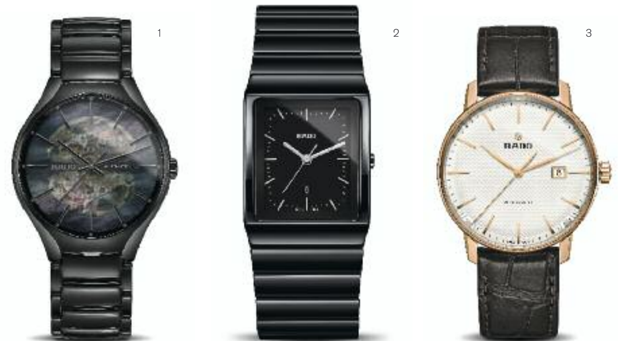
1 | Rado True Open Heart Automatik; Hightech-Keramik; Ø 40,1 mm; Monobloc-Gehäuse; Perlmutterzifferblatt; wasserdicht bis 5 bar (50 m) | Preis 2.200,- Euro, limitiert auf 500 Ex. 2 | Rado Ceramica Quarz; Hightech-Keramik; Ø 30 x 41,7 mm; Saphirglas; wasserdicht bis 5 bar (50 m) | Preis 1.780,- Euro 3 | Rado Coupole Classic Automatik; Edelstahl; Ø 41 mm; Saphirglas; wasserdicht bis 5 bar (50 m) | Preis 1.330,- Euro

Der Schweizer Uhrenhersteller Rado ist bekannt für sein Design und die Verwendung revolutionärer Materialien. So gilt die Hightech-Keramik der Rado-typischen Monobloc-Gehäuse als eines der leichtesten Materialien in der Uhrmacherei. Die Robustheit und die Langlebigkeit sind weitere herausragende Eigenschaften der Hightech-Keramik.