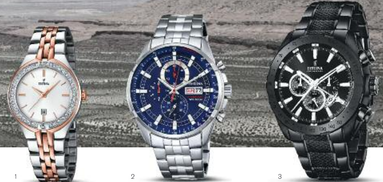
1 | Mademoiselle Quarz; Edelstahl, Ø 33 mm; Indexe rotgold, 30 Steine; wasserdicht bis 5 bar; Edelstahllamband | Preis 129,- Euro 2 | Sport Chronograph Quarz; Edelstahl, Ø 44 mm; wasserdicht bis 5 bar; Edelstahllamband | Preis 159,- Euro 3 | Prestige Quarz; Edelstahl/PVD, Ø 46 mm; wasserdicht bis 10 bar; Edelstahllamband | Preis 299,- Euro