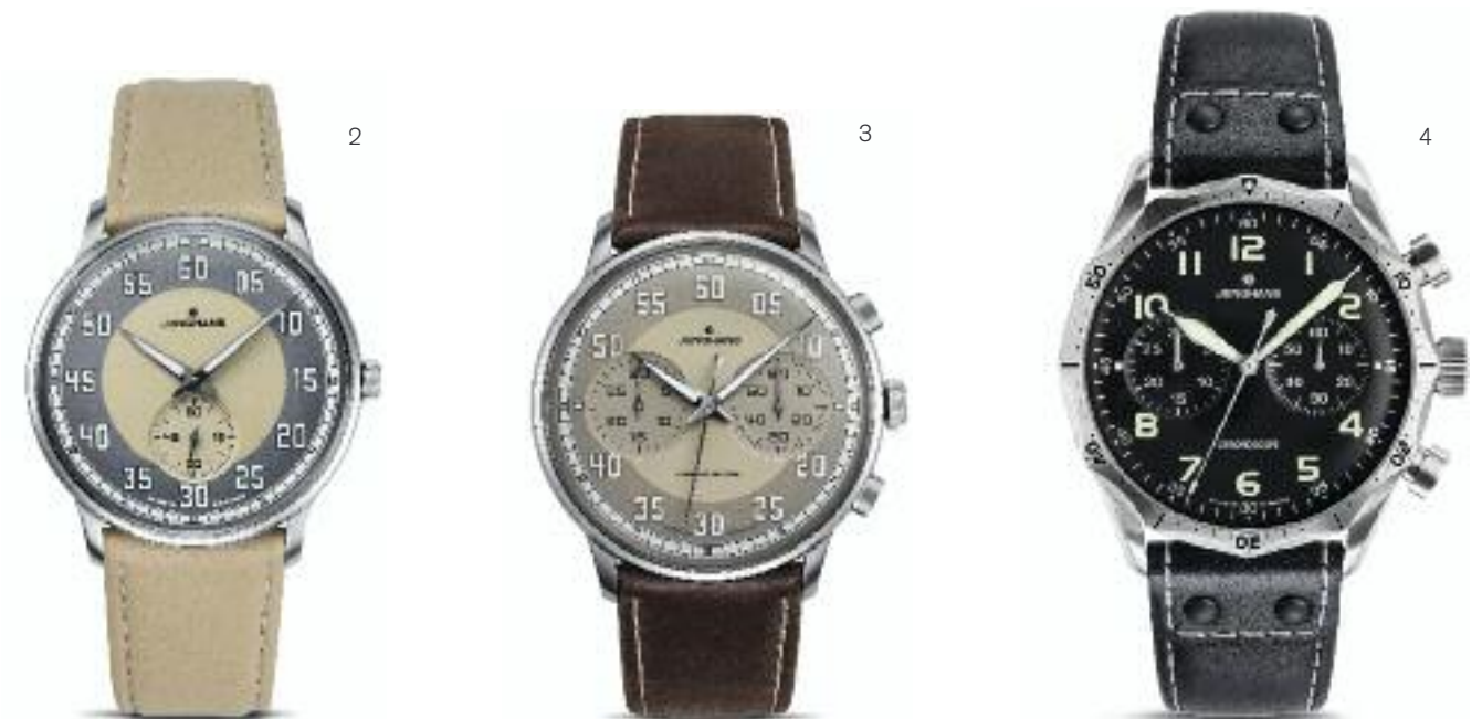
1 + 2 | Meister Driver Handaufzug Edelstahl Ø 37,7 mm; Plexi-Hartglas; Sichtboden; wasserdicht bis 3 bar; Kalbslederband mit Dornschnelle | Preis 1.170,- Euro 3 | Meister Driver Chronoscope Edelstahl Ø 40,8 mm; Automatik; Plexi-Hartglas; Sichtboden; wasserdicht bis 3 bar; Kalbslederband mit Dornschnelle | Preis 1.990,- Euro 4 | Meister Pilot Edelstahl Ø 43,3 mm; Automatik; Saphirglas; wasserdicht bis 10 bar; vernietetes Lederband mit Dornschnelle | Preis 2.240,- Euro

Die Meister-Driver-Kollektion bringt gekonnt den Charme und die Ästhetik der Oldtimer aus den 1930er Jahren zum Ausdruck. Das Modell Meister Pilot macht mit seinem unverwechselbaren Design und seiner mechanischen Unabhängigkeit diese Uhr zum perfekten Kopiloten am Handgelenk.