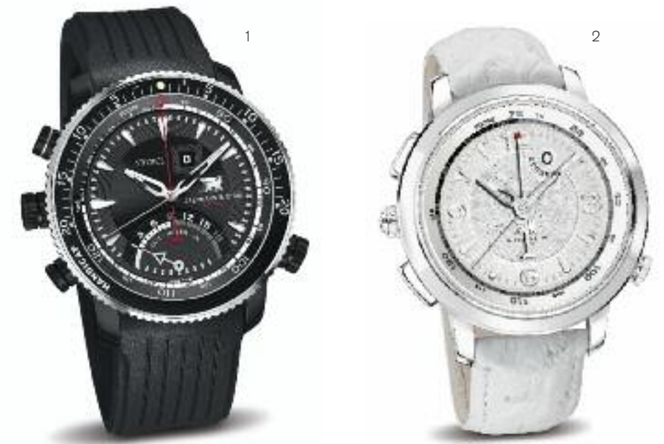
1 | Hole in One PVD-Edelstahl, Ø 44 mm; Automatikwerk A10; Saphirglas; wasserdicht bis 10 bar; Kautschukband; Faltschließe Preis 7.900,- Euro 2 | Queen of Golf (Art Deco) Edelstahlgehäuse, Ø 38 mm; Automatikwerk A10; Saphirglas; wasserdicht bis 5 bar; Lederband weiß; Dornschieße Preis 5.900,- Euro

Jaermann & Stübi sind die Erfinder der mechanischen Golfuhr, die in jeder Hinsicht einzigartig ist. Vom Design her ein zeitloser Klassiker, vom Werk her eine noch nie da gewesene Komplikation und extrem robust mit dem speziell für das Golfspiel entwickelten Shock-Absorber. Die Luxus-Uhr mit ihrem hochwertigen Golfcounter ist in der Lage, die Schläge pro Loch beim Golfspiel zu zählen und das Gesamtscore zu berechnen.