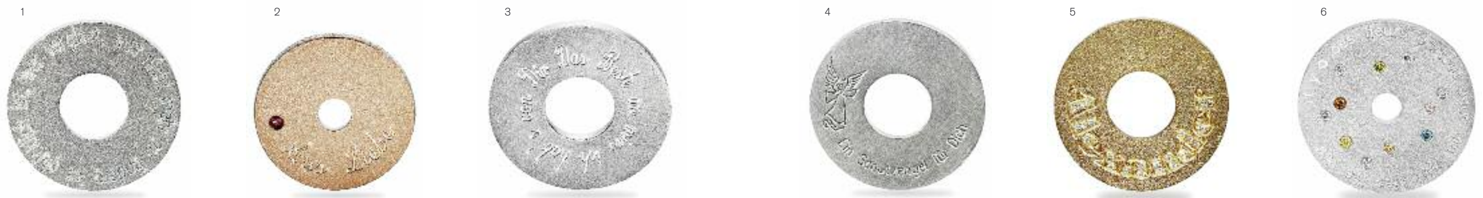
1 | Glücks-Taler 925er Silber; Ø 24 mm | Preis 117,- Euro 2 | Liebes-Taler Rückseite in 925er Silber; Ø 20 mm; Vorderseite in 585er Roségold; Rubin | Preis 345,- Euro 3 | Eltern-Taler 925er Silber; Ø 24 mm | Preis ab 117,- Euro

Mit dem Liebestaler aus Silber oder Gold – diamantgraviert, kostbar und unverwechselbar – lässt sich auf wundervolle Art und Weise eine individuelle Botschaft transportieren. Sie können den Liebestaler mit vorgefertigten Gravuren für verschiedenste Anlässe erwerben oder Sie lassen sich Ihre ganz persönliche Botschaft gravieren. Auf unserer Website finden Sie unter www.nusstein.de/liebestaler einen Liebestaler-Konfigurator, mit dem Sie Ihren Wunsch-Liebestaler zusammenstellen können.