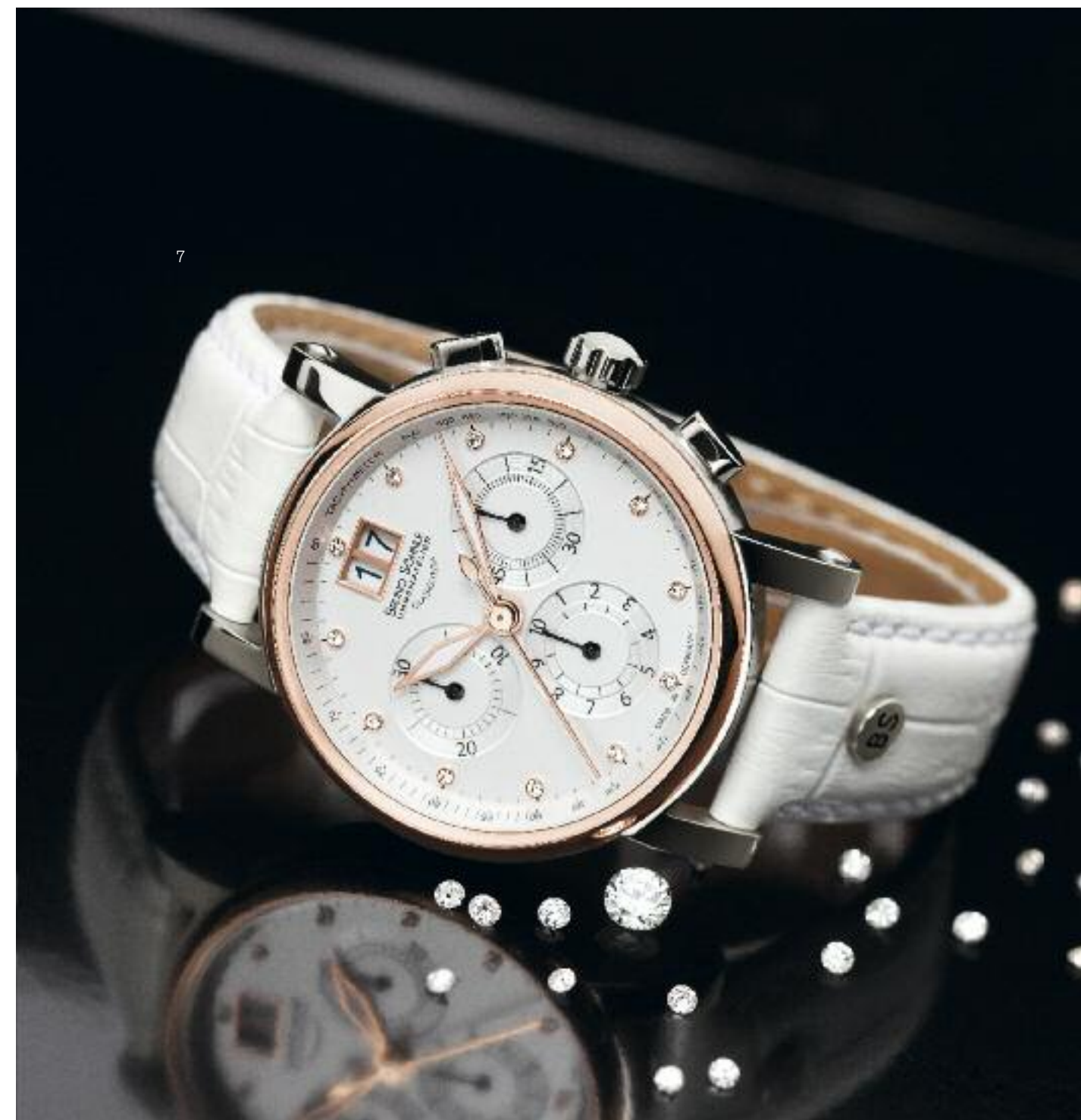
1 | Pesaro II Quarzwerk Ronda 7004P; Edelstahl, Ø 43 mm; Saphirglas; wasserdicht bis 10 bar; Kalbslederarmband | Preis 585,- Euro 2 | Marcato Quarzwerk Ronda 8040N; Edelstahl, Ø 44 mm; Saphirglas; Glasboden; wasserdicht bis 10 bar; Kalbslederarmband | Preis 725,- Euro 3 | Triest Big Quarzwerk Ronda 6004D; Edelstahl, Ø 42 mm; Saphirglas; wasserdicht bis 10 bar; Edelmetallarmband | Preis 495,- Euro 4 | Legato Classic Quarzwerk Ronda 6003D; Edelstahl, Ø 43 mm; Saphirglas; wasserdicht bis 5 bar; Kalbslederarmband | Preis 385,- Euro 5 | Atrium Quarzwerk Ronda 6004D; Edelstahl Ø 38 mm; Saphirglas; Glasboden; wasserdicht bis 5 bar; Kalbslederarmband | Preis 375,- Euro 6 | Nofrit Quarzwerk Ronda 1062; Edelstahl, Ø 34 mm; Saphirglas; Perlmutterzifferblatt mit 1 Brillant (0,005 ct.); wasserdicht bis 3 bar; Lederarmband | Preis 390,- Euro 7 | Armida Quarzwerk Ronda 5040B; Edelstahl, Ø 36 mm; 12 Brillanten (0,06 ct.); Saphirglas; Glasboden; wasserdicht bis 10 bar; Kalbslederarmband | Preis 725,- Euro