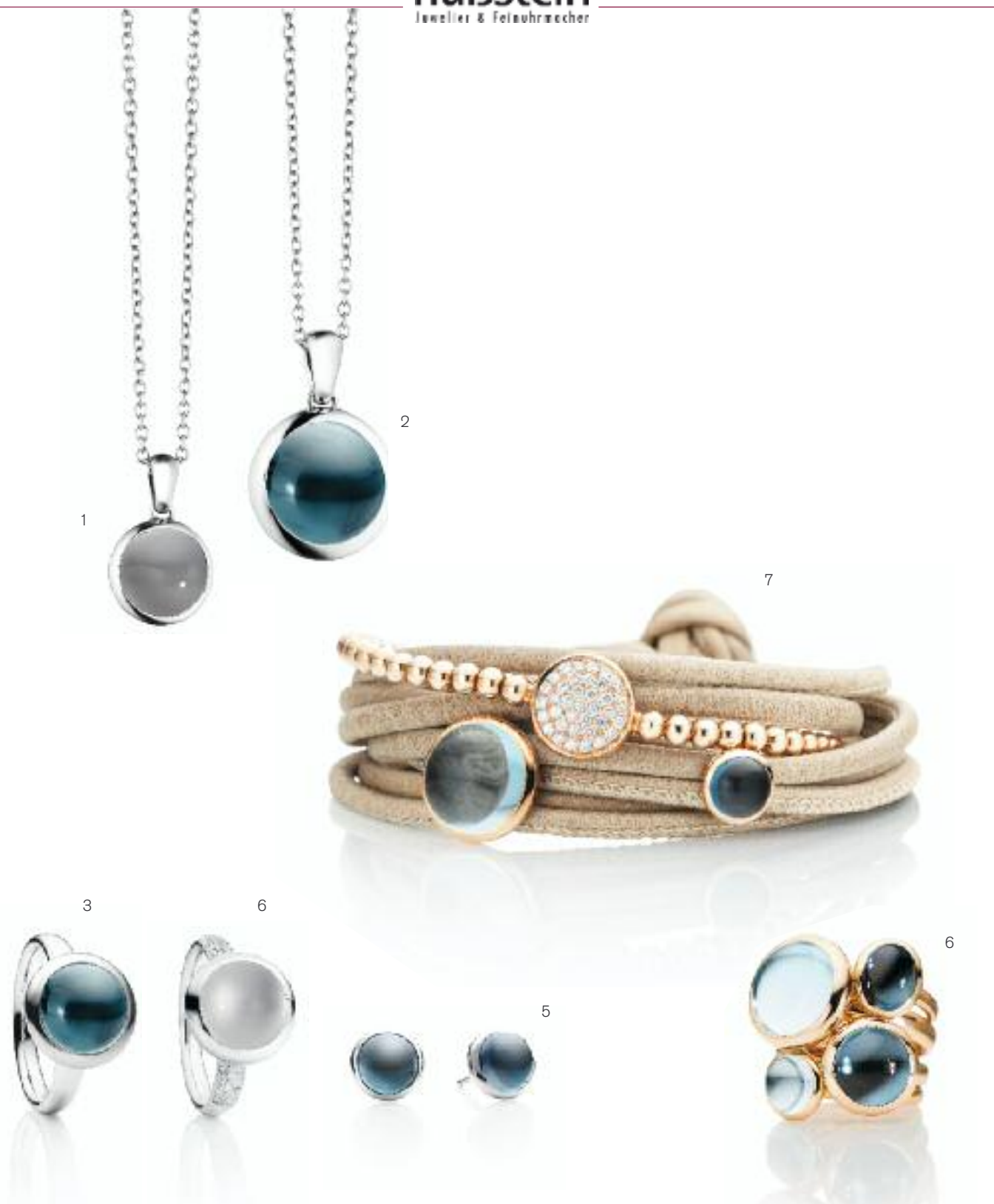
1 | Anhänger „Velluto“ 750 WG; Mondstein hellgrau; Cabochon Ø 8 mm, ca. 2,0 ct | Preis 595,- Euro 2 | Anhänger „Velluto“ 750 WG; London Blue Topas; Cabochon Ø 11 mm | Preis 1.250,- Euro 3 | Ring „Velluto“ 750 WG; Mondstein white blue; Cabochon Ø 11 mm, ca. 5,1 ct; Pavé 30 Brillanten (0,26 ct) | Preis 3.500,- Euro 4 | Ring „Velluto“ 750 WG; London Blue Topas; Cabochon Ø 11 mm, ca. 6,4 ct | Preis 1.950,- Euro 5 | Ohrstecker „Velluto“ 750 WG; London Blue Topas; Cabochon Ø 8 mm, ca. 5,0 ct | Preis 1.250,- Euro 6 | Ringe „Velluto“ 750 RG; Topas; London Blue Topas | Preis ab ca 3,0 ct 1.050,- Euro | bis ca. 13,0 ct 2.450,- Euro 7 | Schmuckelement „Velluto“ 750 RG | Preis London Blue Topas ab ca 3,0 ct 550,- Euro | bis Topas ca. 11,0 ct 595,- Euro | Flexibles Armband „Dolcini“ 750 RG; 37 Brillanten (0,59 ct) | Preis 3.500,- Euro | Lederarmband Sand | Preis 59,- Euro