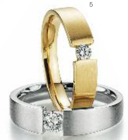
1 | Ohrstecker 585er Weißgold; Brillanten 0,20 ct. | Preis 650,- Euro 2 | Ohrstecker 585er Gelbgold; Brillanten 0,20 ct. | Preis 650,- Euro 3 | Kette mit Anhänger 585er Gelbgold; Brillanten 0,15 ct. | Preis 860,- Euro 4 | Ringe 585er Weißgold; Brillanten ab 0,05 ct. | Preis ab 380,- Euro 5 | Ring 585er Gelbgold; Brillanten 0,05 ct. | Preis 385,- Euro 6 | Ring 585er Weißgold; Brillanten 0,10 ct. | Preis 595,- Euro