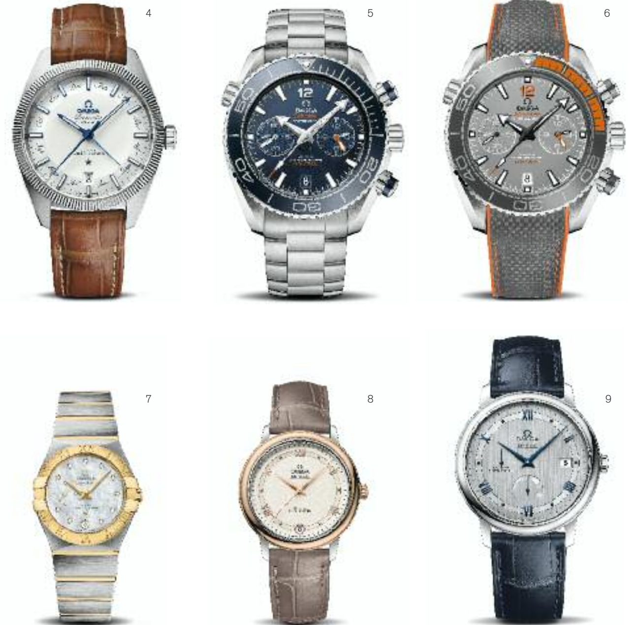
3 | Seamaster Planet Ocean Automatik; Co-Axial Master Chronometer; antimagnetisch bis 15.000 Gauß; Edelstahl, Ø 43,5 mm; wasserdicht bis 60 bar; Kautschukband | Preis 5.700,- Euro 4 | Globemaster Annual Calendar Automatik; Co-Axial Master Chronometer; antimagnetisch bis 15.000 Gauß; Edelstahl, Ø 41 mm; wasserdicht bis 10 bar; Alligatorlederband | Preis 7.700,- Euro 5 | Seamaster Planet Ocean Chronograph Automatik; Co-Axial Master Chronometer; antimagnetisch bis 15.000 Gauß; Edelstahl, Ø 45,5 mm; wasserdicht bis 60 bar; Edelstahlband | Preis 7.400,- Euro 6 | Seamaster Planet Ocean Chronograph Automatik; Co-Axial Master Chronometer; antimagnetisch bis 15.000 Gauß; Titan, Ø 45,5 mm; wasserdicht bis 60 bar; Kautschukband | Preis 8.800,- Euro 7 | Constellation Small Seconds Automatik; Co-Axial Master Chronometer; antimagnetisch bis 15.000 Gauß; Edelstahl/18K Gelbgold, Ø 27 mm; Perlmutterzifferblatt mit 14 Diamanten (0,05 ct.); wasserdicht bis 10 bar; Edelstahl/18K Gelbgoldband | Preis 7.700,- Euro 8 | De Ville Prestige Automatik; Co-Axial Chronometer; Edelstahl/18K Rotgold, Ø 32,7 mm; wasserdicht bis 3 bar; Alligatorlederband | Preis 4.100,- Euro 9 | De Ville Prestige Power Reserve Automatik; Co-Axial Chronometer; Edelstahl, Ø 39,5 mm; wasserdicht bis 3 bar; Alligatorlederband | Preis 4.000,- Euro