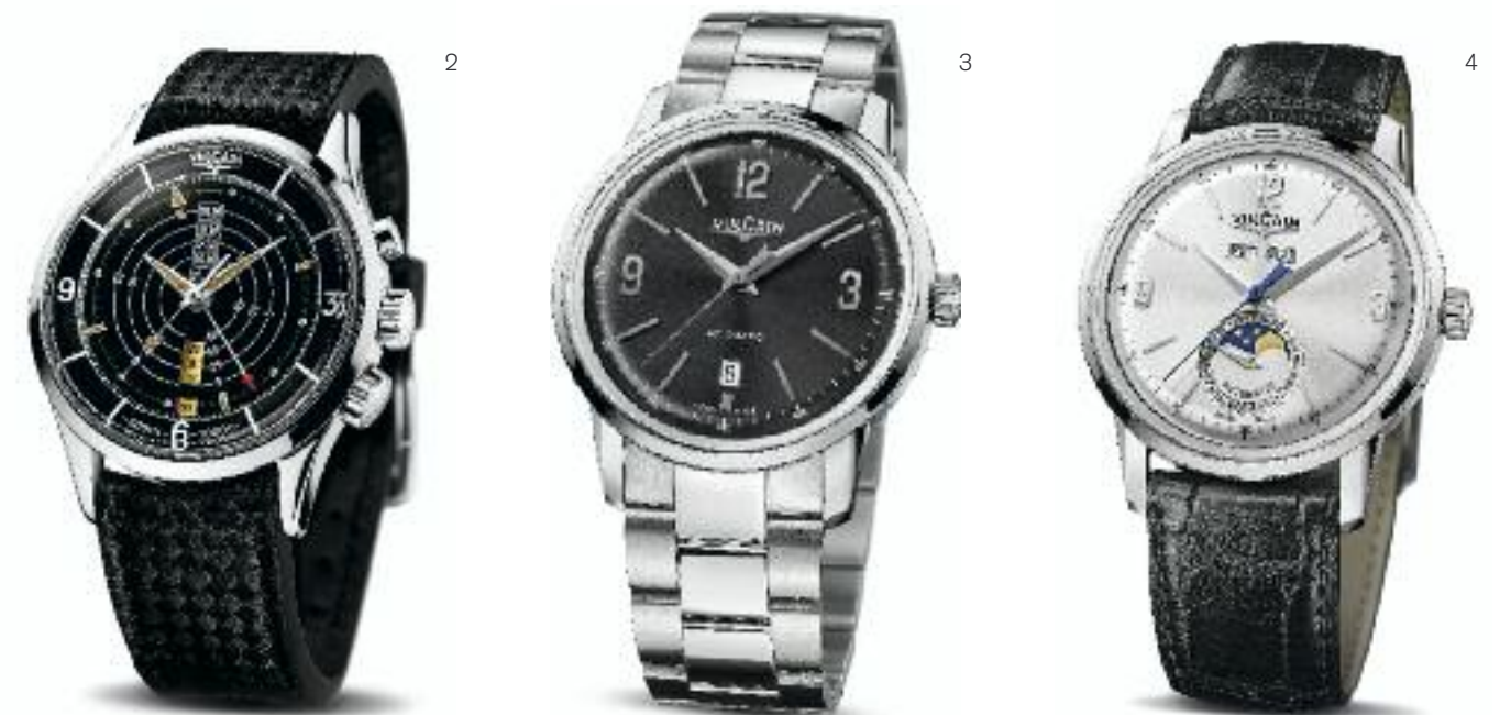
1 | Nautical Seventies Handaufzug; Edelstahl Ø 42 mm; Saphirglas; wasserdicht bis 30 bar; wasserresistentes Lederarmband | Preis 3.970,- Euro, limitiert auf 300 Ex. 2 | Nautical Heritage Handaufzug; Edelstahl Ø 42 mm; Alarm; Plexiglas; wasserdicht bis 30 bar; wasserresistentes Lederarmband | Preis 3.970,- Euro, limitiert auf 1961 Ex. 3 | 50s Presidents' Watch Classic Automatik, Edelstahl Ø 42 mm; 42 Std. Gangreserve; Saphirglas; Sichtboden; wasserdicht bis 5 bar; Edelstahlband | Preis 2.650,- Euro 4 | 50s Presidents' Watch Classic Moonphase Automatik, Edelstahl Ø 42 mm; 42 Std. Gangreserve; Saphirglas; Sichtboden; wasserdicht bis 5 bar; Alligatorlederarmband | Preis 4.400,- Euro

Mitte des 20. Jahrhunderts lancierte Vulcain mit dem Cricket-Kaliber das erste mechanische Schlagwerk, die erste wirklich funktionstüchtige Armbanduhr mit Wecker. Von einigen amerikanischen Präsidenten getragen, erlangte die Uhr einen ausgezeichneten Ruf. Die technischen Qualitäten der Vulcain-Zeitmesser sollten aber auch Erforscher und Abenteurer begeistern. Seit den 1950er Jahren sind sie Partner von berühmten Expeditionen, tief hinab in die Meere und hoch hinauf in die Berge.