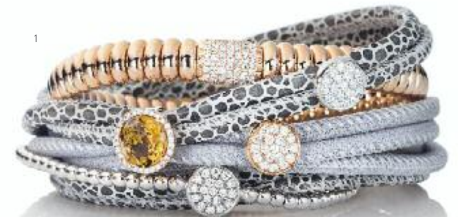
1 | Armband „Eleganza“ 750 RG; 45 Brillanten (0,39 ct); innen Ø 17 cm | Preis 4.750,- Euro | Schmuckelement „Espressivo“ 750 RG; Citrin facettiert, Ø 9 mm; 28 Brillanten (0,14 ct) | Preis 1.095,- Euro | Schmuckelement „Dolcini“ 750 WG und RG; 19 Brillanten (0,14 ct) | Preis 995,- Euro | Armband „Dolcini“ 750 WG; 19 Brillanten (0,27 ct); innen Ø 17 cm | Preis 2.150,- Euro | Armband Leder grau | Preis 59,- Euro

Juwelen gewordene Leidenschaft ist das einzigartige Markenversprechen von Capolavoro. In ihm schlägt das Herz seines international hohen Prestiges als Schmuckmarke von ganz besonderem Luxus: Es ist die Leidenschaft selbst, ohne die ein Meisterwerk – und nichts anderes bedeutet der Name Capolavoro – nicht entstehen kann.