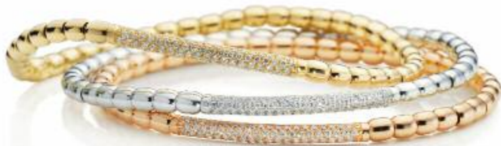
Armbänder 750 Gelb-, Weiß- und Roségold; je 80 Brillanten (0,43 ct) Preis je 2.735,- Euro

Strahlende Kunstwerke von beweglicher Ausdruckskraft, einfach oder mehrfach kombiniert getragen, verleihen sie jeder Frau eine lässig elegante Note. Ästhetische Schlichtheit, hochwertige Materialien und eine weiche Formensprache kennzeichnen die flexiblen, dehnbaren und beweglichen Armbänder von Capolavoro. Handgearbeitet aus 18-karätigem Gold und feinen Diamanten. Alle Schmuckstücke sind Ausdruck höchster Qualität in Design, Ästhetik, Material und Verarbeitung.