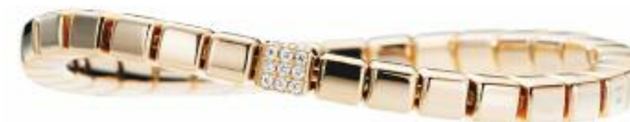
Armband 750 Roségold; 36 Brillanten (0,30 ct) Preis 4.470,- Euro

Großes Aufsehen, große Pracht. Glänzendes Spiel der Formen. Ein Band aus Gold und Diamanten gehalten von beweglichen Elementen. Mit jeder Bewegung ein anderes Bild, eine andere Nuance, ein anderes Licht. Ein Meisterwerk kostbarer Eleganz und eigenen Stils.