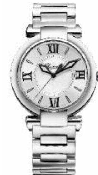
Imperiale Quarzwerk; Edelstahlgehäuse, Ø 36 mm; Datum; silberfarbenes Zifferblatt; Krone mit Amethyst (0,10 ct); wasserdicht bis 50 m; Edelstahlarmband Preis 5.700,- Euro