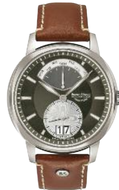
Facetta Ref. 17-73166-747 (li.) Werk Ronda 8040.B, veredelte BS-Version; Edelstahlgehäuse, Ø 46 mm; entspiegelt Saphirglas, Glasboden; wasserdicht bis 5 bar; Kalbslederband Preis 795,- Euro