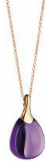
Anhänger 750 Roségold; Cabochon Amethyst Preis 995,- Euro