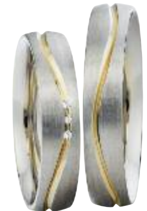
585 Gelbgold; 585 Weißgold; Brillanten ges. 0,015 ct.