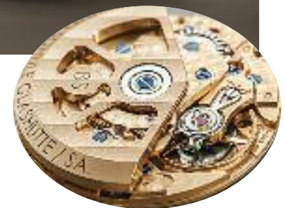
Im Herzen des Uhrwerks schlägt eine Schweizer Technologie. Alle Platinen und Ankerbrücken werden in Glashütte hergestellt und veredelt. Der Rotor, Synonym für den automatischen Antrieb des ganggenauen Uhrwerks, ist eine Eigenentwicklung von Bruno Söhnle.

Söhnle“ entwickelt sich zunehmend zum Synonym eines Einstiegs in die Faszination traditioneller Glashütter Uhrmacherkunst mit modernen Komponenten.