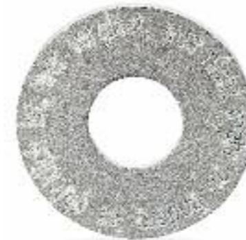
Glücks-Taler 925 Silber; Ø 24 mm; „Glücklich ist, wer vergisst, was nicht mehr zu ändern ist“ Preis 117,- Euro

Die Kaufabwicklung läuft dann über unser Ladengeschäft. Jede Gravur wird mit Diamantwerkzeugen ausgeführt, so dass sie kostbar funkeln. Liebestaler, Botschaftstaler oder Wertetaler: Für jeden Anlass finden Sie das passende Geschenk, mit dem Sie dem Empfänger zeigen können, dass er Ihnen wertvoll ist.