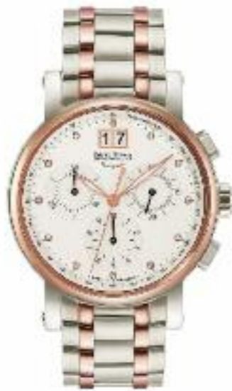
Armida Ref. 17-63115-954 (li.) Ref. 17-63115-751 (M.) Werk Ronda 5040.B, veredelte BS-Version; Edelstahlgehäuse oder Edelstahl ionenplattiert rosé, Ø 36 mm; Saphirglas, innen entspiegelt; verschraubte Krone und verschraubter K1-Glasboden; 12 Brillanten WSi, 0,06 ct. gesamt; wasserdicht bis 10 bar; Kalbslederband mit Faltschließe oder massives Edelstahlband mit Doppelfaltschließe Preis 795,- | 725,- Euro