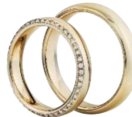
585 Roségold; Brillanten ges. 0,23 ct.

Bei der Gestaltung unserer eigenen Trauringideen mit unseren Partnern ist erstklassige Qualität, 100% made in Germany, oberstes Gebot. Ebenso wollen wir Aspekten der Schonung der Umwelt Rechnung tragen, denn auch beim Kauf von Trauringen kann man nachhaltig produzierte Produkte vorziehen und somit einen aktiven Beitrag zum Schutz und zur Erhaltung unserer Erde leisten. Wir verwenden schon seit Jahren ausschließlich „Faires Gold“, also Gold aus Recycling-Beständen, das nach strengen Auflagen der deutschen Umweltschutzgesetze aufbereitet wird. Beim Einkauf von Diamanten achten wir ebenfalls darauf, dass die strenge UN-Resolution eingehalten wird und dass die Herkunft aus konfliktfreien Ländern gewährleistet ist. Weitere Informationen finden Sie unter www.nusstein.de/de/trauringe .