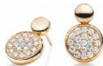
Ohrschmuck 750 Roségold; 38 Brillanten (0,71 ct) Preis 2.845,- Euro