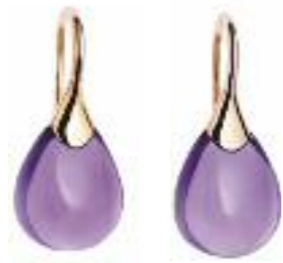
Ohrschmuck 750 Roségold; Cabochon Amethyst Preis 1.395,- Euro