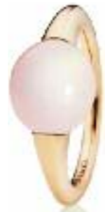
Ring 750 Roségold; Cabochon Rosenquarz Preis 1.295,- Euro