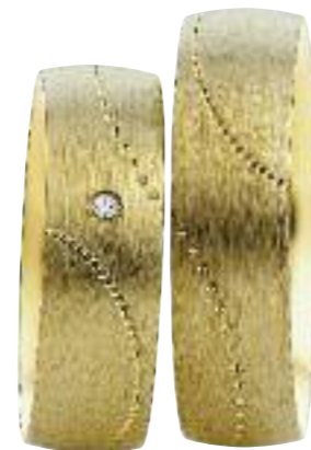
585 Gelbgold; 1 Brillant 0,01 ct.