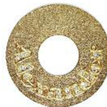
Namens-Taler 585 Roségold; Brillant; Ø 24 mm; mit Brillanten nach Bedarf 23 x 0,005 ct. TWsi Preis 1.990,- Euro