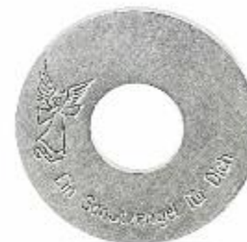
Schutzengel-Taler 925 Silber; Ø 24 mm; „Ein Schutzengel für Dich“ Preis 134,- Euro