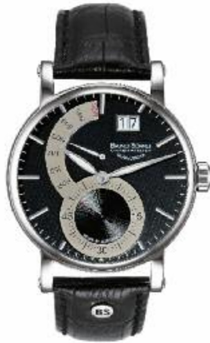
Pesaro Automatik II (li.) Ref. 17-12150-267 Veredeltes Automatikwerk BS-Version; Edelstahlgehäuse Ø 44 mm; Saphirglas, innen entspiegelt; wasserdicht bis 10 bar; Kalbslederband Preis 1950,- Euro