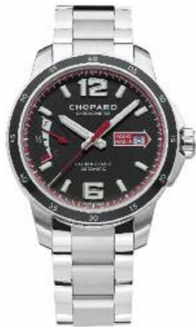
Mille Miglia GTS Power Control Automatik, Gangreserve 60 Std.; Edelstahlgehäuse, Ø 43 mm; COSC- zertifizierter Chronometer; Datum; Sekundenstopp; Gangreserveanzeige; oben entspiegeltes kratzfestes Saphirglas und Saphirglasboden; wasserdicht bis 100 m; Edelstahlarmband Preis 6.880,- Euro