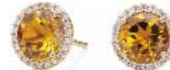
Ohrschmuck 750 Roségold; Citrin; 44 Brillanten (0,16 ct) Preis 1.177,- Euro