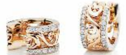
Ohrschmuck 750 Roségold; 40 Brillanten (0,42 ct) Preis 2.865,- Euro