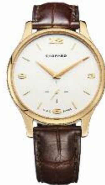
L.U.C. XPS Automatik, Gangreserve 65 Std.; Gehäuse 18 Karat Roségold, Ø 39,5 mm; COSC-zertifizierter Chronometer; kleine Sekunde; Sekundenstopp; entspiegeltes kratzfestes Saphirglas; wasserdicht bis 30 m; Alligatorlederarmband; Goldschließe Preis 13.990,- Euro

Ultimativer Klassizismus, majestätische Anmut, sportliche Eleganz: Die Damen- und Herrenuhrenkollektionen lassen keine Wünsche offen. Das gilt auch für die Technologie. Im Jahr 1996 eröffnete Chopard eine Uhrenmanufaktur in Fleurier im Schweizer Jura. Hier werden die hauseigenen L.U.C.-Werke entwickelt und produziert.