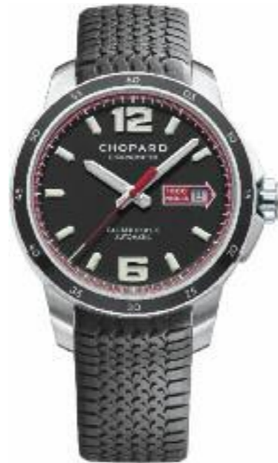
Mille Miglia GTS Automatic Automatik, Gangreserve 60 Std.; Edelstahlgehäuse, Ø 43 mm; COSC- zertifizierter Chronometer; Datum; Sekundenstopp; oben entspiegeltes kratzfestes Saphirglas und Saphir- glasboden; wasserdicht bis 100 m; schwarzes Kautschukarmband; Faltschließe Preis 5.070,- Euro