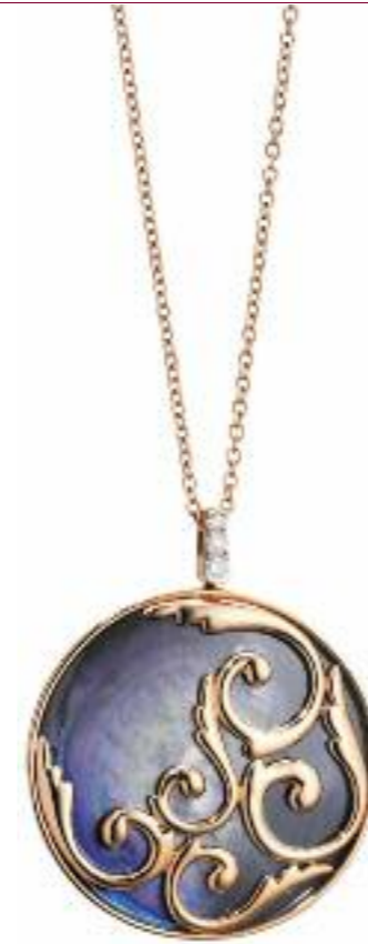
Anhänger 750 Roségold; Perlmutter; Brillantschleife 3 Brillanten (0,18 ct) Preis 3.680,- Euro