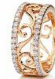
Ring 750 Roségold; 70 Brillanten (0,95 ct) Preis 3.735,- Euro