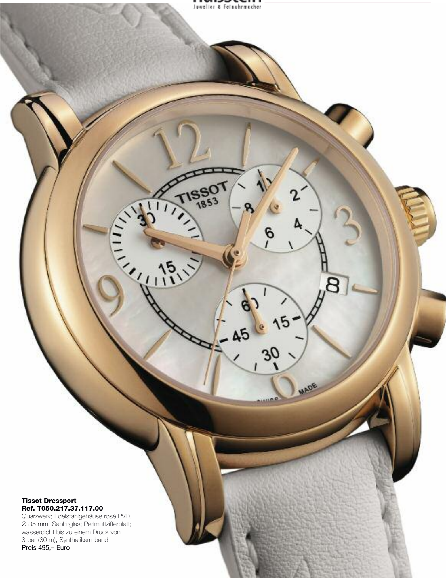
Tissot Dressport Ref. T050.217.37.117.00

Als offizieller Zeitmesser und Partner von FIBA, AFL, MotoGP™, FIM Superbike und den Weltmeisterschaften im Radsport, Fechten und Eishockey drückt die Marke Tissot deutlich ihre mit großer Verpflichtung gegenüber der Tradition vertretenen Werte aus: Leistung, Präzision und das Setzen neuer Standards.