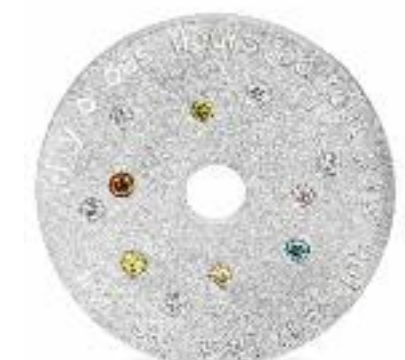
Matisse-Taler 585 Weißgold; farbige Brillanten; Ø 24 mm; Text von Matisse französisch/deutsch: „Es gibt überall Blumen für den, der sie sehen möchte“ Preis 2.050,- Euro