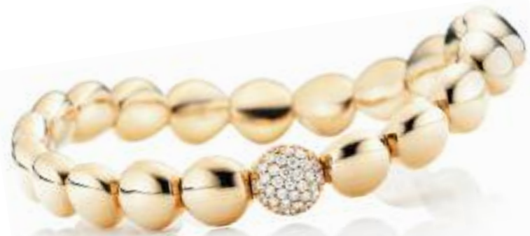
Armreif 750 Roségold; 31 Brillanten (0,61 ct) Preis 3.355,- Euro