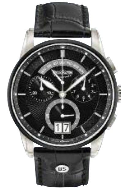
Marcato (re.) Ref. 17-13143-841 Quarzwerk in veredelter BS-Version; Edelstahlgehäuse Ø 44 mm; Saphirglas, innen entspiegelt; wasserdicht bis 10 bar; Kalbslederband mit Doppelfaltschließe Preis 725,- Euro