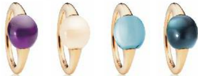
Ringe 750 Roségold; Cabochon (v. li. n. re.) Amethyst Preis 1.295,- Euro Mondstein champagner Preis 1.485,- Euro Topas Preis 1.295,- Euro London blue Topas Preis 1.295,- Euro

Schmuck in den Farben eines rosaroten und tief violetten Abendhimmels. Mit einem Hauch von Romantik, frei in der Form, transparent scheinend in den Goldfassungen. Ovale und Tropfen, schimmernd und anschmiegsam, pur und voller Magie, wie die Frau, die den Schmuck trägt. Schmuck, der Sehnsüchte und Träume wahr werden lässt.