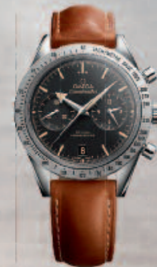
Speedmaster GEORGE CLOONEY'S CHOICE