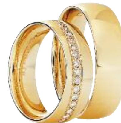
585 Roségold; Brillanten ges. 0,255 ct.