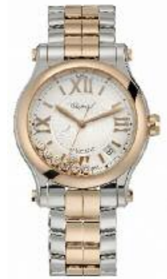
Happy Sport Automatik; Gangreserve ca. 42 Std.; Gehäuse Rotgold/Edelstahl, Ø 36 mm; Datum; entspiegeltes kratzfestes Saphirglas; Saphirglasboden; Krone mit Saphir (0,17 ct.); 7 Brillanten lose (0,35 ct.); wasserdicht bis 30 m; Armband Rotgold/Edelstahl Preis 14.450,- Euro