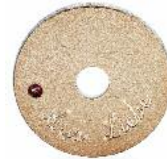
Liebes-Taler Rückseite in 925 Silber; Ø 20 mm; Vorderseite in 585 Roségold; Rubin; „Aus Liebe“ Preis 336,- Euro