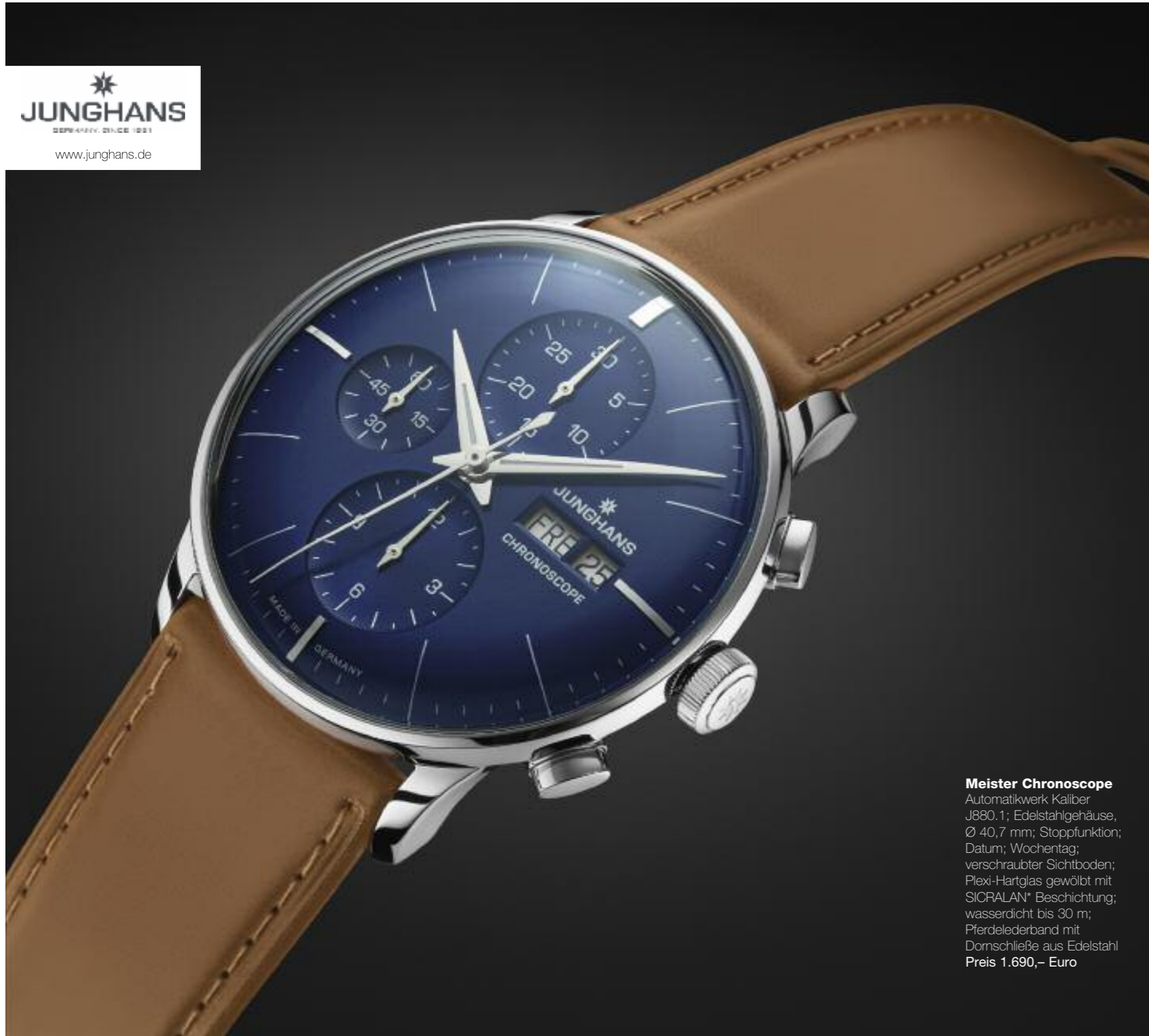
Meister Chronoscope Automatikwerk Kaliber J880.1; Edelstahlgehäuse, Ø 40,7 mm; Stoppfunktion; Datum; Wochentag; verschraubter Sichtboden; Plexi-Hartglas gewölbt mit SICRALAN* Beschichtung; wasserdicht bis 30 m; Pferdelederband mit Dornschnalle aus Edelstahl Preis 1.690,- Euro