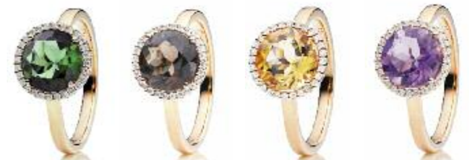
Ringe 750 Roségold; je 28 Brillanten (0,14 ct) (v. li. n. re.) Turmalin grün Preis 3.970,- Euro Rauchquarz Preis 1.535,- Euro Citrin Preis 1.575,- Euro Amethyst hell Preis 1.565,- Euro

Klassisch eleganter Schmuck, ausdrucksstark und von großer Ausstrahlung. Die Steine im Zentrum wetteifern in allen Facetten mit dem Strahlen der sie umgebenden Brillanten. Schmuckkreationen voller Lebensfreude für Frauen, die mit Farben Ausdruck verleihen und auf ein Funkeln der Diamanten nicht verzichten wollen. Von morgens bis abends tragbar verschönern sie jedes Outfit von Jeans bis zum Abendkleid.