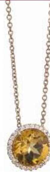
Anhänger 750 Roségold; Citrin; 28 Brillanten (0,14 ct) Preis 990,- Euro