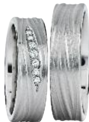
585 Weißgold; Brillanten ges. 0,09 ct.