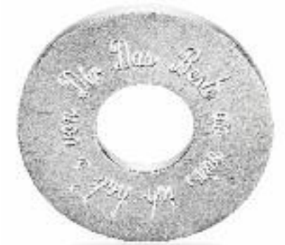
Eltern-Taler 925 Silber; Ø 24 mm; „Das Beste an mir, ich hab's von Dir“ Preis 116,- Euro