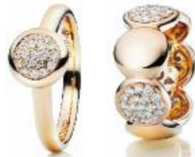
Ringe 750 Roségold 19 Brillanten (0,14 ct) Preis 1.485,- Euro (li.) 750 Roségold 38 Brillanten (0,72 ct) Preis 3.230,- Euro (re.)