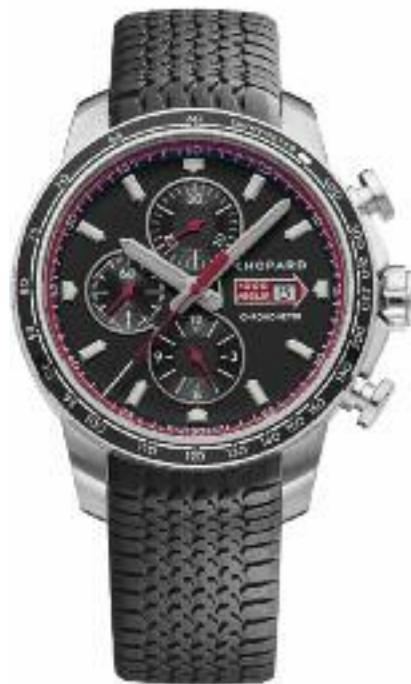
Mille Miglia GTS Chrono Automatik, Gangreserve 48 Std.; Edelstahlgehäuse, Ø 44 mm; Chronograph; COSC-zertifizierter Chronometer; Datum; kleine Sekunde; 12-Stunden-Zähler; entspiegeltes kratzfestes Saphirglas; wasserdicht bis 100 m; schwarzes Kautschukarmband; Faltschließe Preis 6.200,- Euro

Das erstmals im Jahre 1988 aufgelegte Uhrenmodell „Mille Miglia“ ist einem der schönsten Oldtimerrennen der Welt gewidmet, der Mille Miglia, die jährlich in Italien stattfindet. Die Kollektion bietet ausdrucksstarke, höchst präzise Armbanduhren, die die Welt des Autorennens ans Handgelenk bringen.